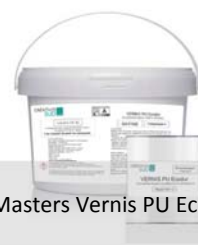
Masters Vernis PU Ecodur