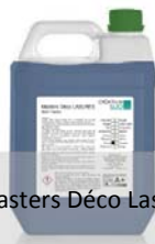
Masters Déco Lasure